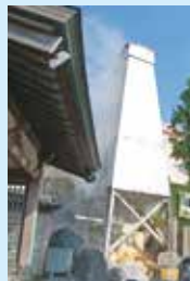
5 Oyukake Benzaiten Statue お湯かけ弁財天