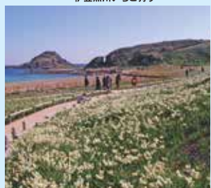
10 Cape Tsumemisaki and narcissus [Mid Dec. – Late Jan.] 爪木崎と水仙 [12月中旬～1月下旬]