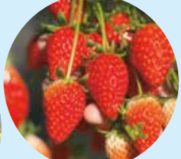
4 Izu Atagawa strawberry picking 伊豆熱川いちご狩り