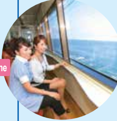
20 Shirata Coast from train 白田海岸の車窓