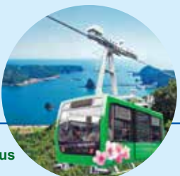
8 Shimoda Ropeway 下田ロープウェイ