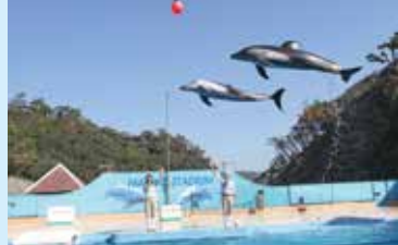
9 Shimoda Aquarium 下田海中水族館