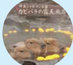
2 Izu Shaboten Zoo 伊豆シャボテン動物公園