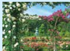
7 Kawazu Bagatelle Park [Spring rose season: Apr. 28 – Jun. 30] [Autumn rose season: Oct. 1 – Nov. 30] 河津バガテル公園 【春バラシーズン4月28日～6月30日】 【秋バラシーズン10月1日～11月30日】

Free zone (Itō Sta. – Izukyū-Shimoda Sta.) フリー区間 (伊東駅～伊豆急下田駅)