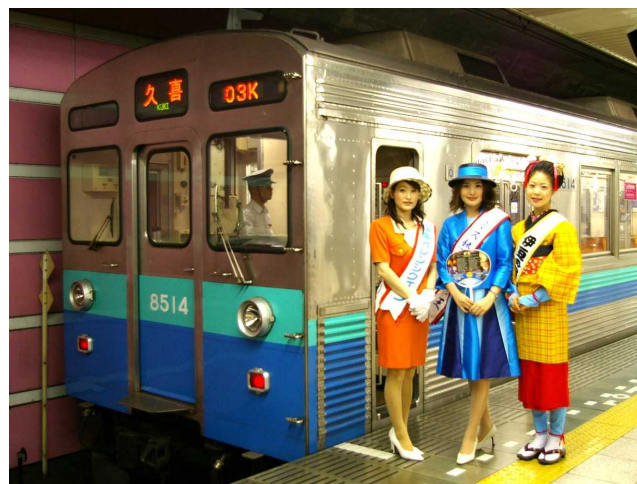
(左)ミスによる「伊豆のなつ号」内でのパンフレット配布と(右)伊豆急カラーに塗装した東急8500系(昨年の様子)

本日、この資料は、国交省記者会、ときわクラブ、横浜経済記者クラブ、伊東記者クラブ、下田記者クラブに配信させていただいております。