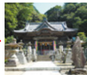
伊豆急下田駅から約35分(片道)

白濱神社は、伊豆の国最古の宮とされる古式ゆかしい神社であり、三嶋大神の最愛の后神である、伊古奈比咩命(イコナヒメノミコ)が主祭神で、三嶋大社と御縁の深い神社であり、相殿には、三嶋大明神(事代主命)が祀られています。