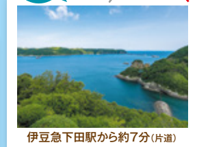
伊豆急下田駅から約7分(片道)

春にはツツジ、初夏には紫陽花、冬には椿が満開となる自然公園です。小高い丘の上にあり、下田港が一望できます。「開国記念碑」や「下岡蓮杖の碑」などがあり、下田の歴史をしのびながら静かに散策を楽しめます。