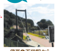
伊豆急下田駅から約25分(片道)