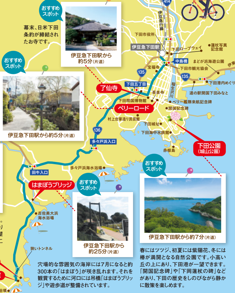
伊豆急下田駅から約25分(片道)

自然にできた急斜面の砂丘。美しい海を目前にそりすべりを楽しむことができます。眺望も美しく、伊豆七島を見渡すことができます。