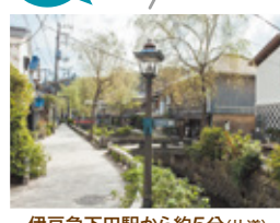
伊豆急下田駅から約5分(片道)