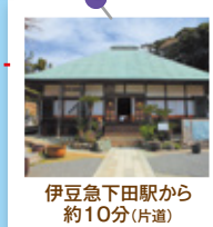
伊豆急下田駅から約10分(片道)

早春の岬、須崎半島の爪木崎に300万本の日本水仙が咲き、岬全体が水仙の甘い香り包まれます。また、白亜の爪木崎灯台からは、伊豆諸島や神子元島、柱状節理など素晴らしい景色が望めます。