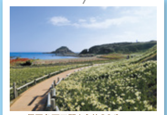
伊豆急下田駅から約30分(片道)

早春の岬、須崎半島の爪木崎に300万本の日本水仙が咲き、岬全体が水仙の甘い香り包まれます。また、白亜の爪木崎灯台からは、伊豆諸島や神子元島、柱状節理など素晴らしい景色が望めます。