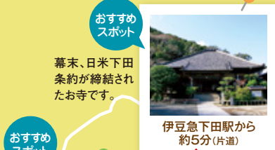
伊豆急下田駅から約5分(片道)