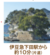
伊豆急下田駅から約10分(片道)