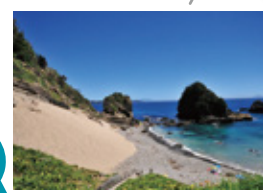
伊豆急下田駅から約30分(片道)

幕末、黒船ののってやってきたペリー提督が歩いたとされるペリーロードは、平滑川沿いに700mほど続いていて、柳並木と石畳が美しい小径です。この一角は明治、大正時代に作られた石造りの洋館や古民家が数多く残っていて、どこか異国情緒あふれるレトロな雰囲気を醸し出しています。