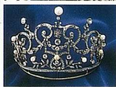
アンティークジュエリーミュージアム