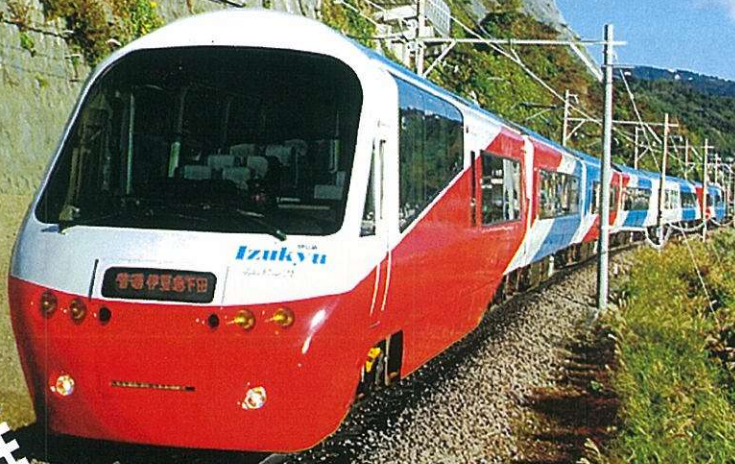
※写真はアルファリゾート21(片瀬白田～伊豆権取間)