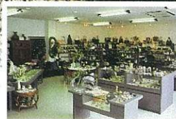
陶磁・ガラス美術館やんもの木