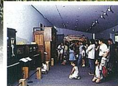
伊豆オルゴール館