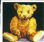
伊豆ティーベアミュージアム