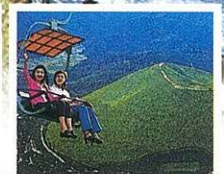
大室山登山リフト