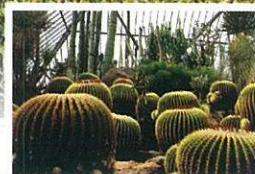
伊豆シャボテン公園